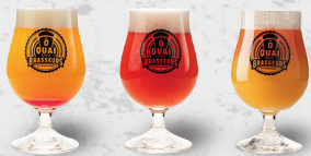
SHANDY DU QUAI 12oz... 8